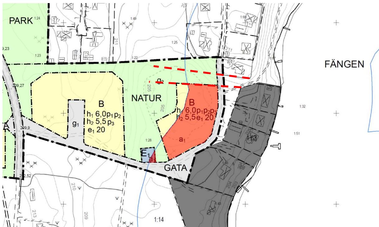
Figur 14: Område i planförslag där strandskydd avses upphävas (röd markering), fri väg till fortsatt tillgänglig strand i röd streckad linje, exploatering vid strandlinje i grått.

Den nya bebyggelsen kommer placeras vid gata bakom den befintliga bebyggelsen vid strandlinjen. Bostadstomterna vid strandlinjen och öppningen mellan dem som används av bostäderna kan tolkas som en samlad exploatering vid strandlinjen. Nya bostadstomter bakom den samlade strandexploateringen medför att kommunen bedömer att detaljplanen enligt andra punkten i Miljöbalken 7 kap. 18 c § genom en väg, järnväg, bebyggelse, verksamhet eller annan exploatering är väl avskilt från området närmast strandlinjen.